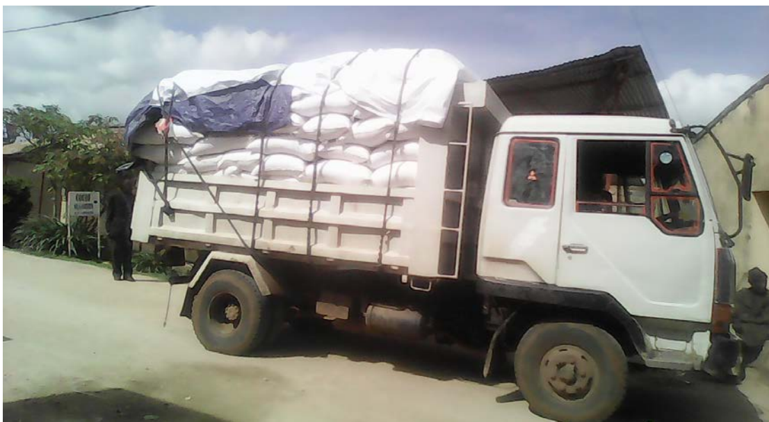
Photo: collecte et transport de la production

ACCOMPAGNER LES PRODUCTEURS POUR MAXIMISER LEUR PRODUCTION PAR L'APPLICATION DE TECHNIQUES MODERNES DE PRODUCTION : semences améliorées, fertilisants y compris les inoculants.