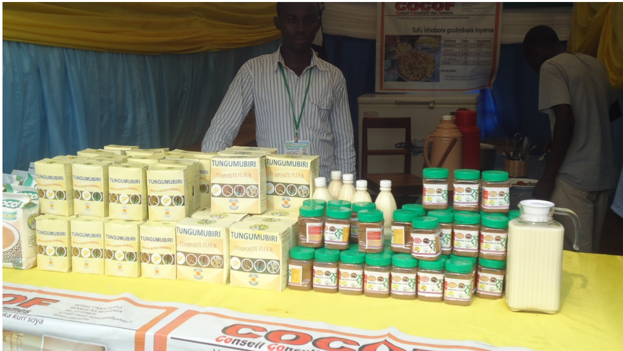
Photos montrant les différents produits dérivés de soja de l'UTA