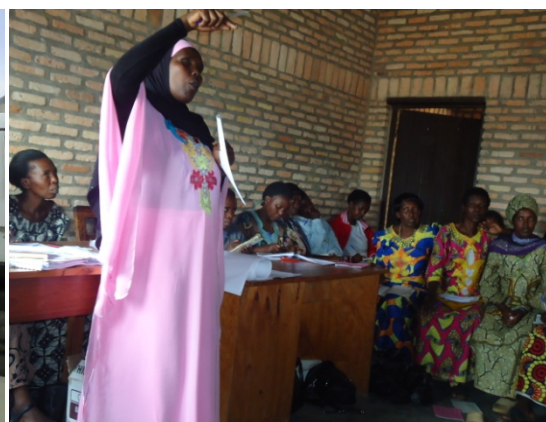
Asssemblée générale de COCOF

Le Conseil Consultatif des Femmes est une organisation rwandaise fondée en Décembre 1994 par un groupe de femmes paysannes du district de Kamonyi.