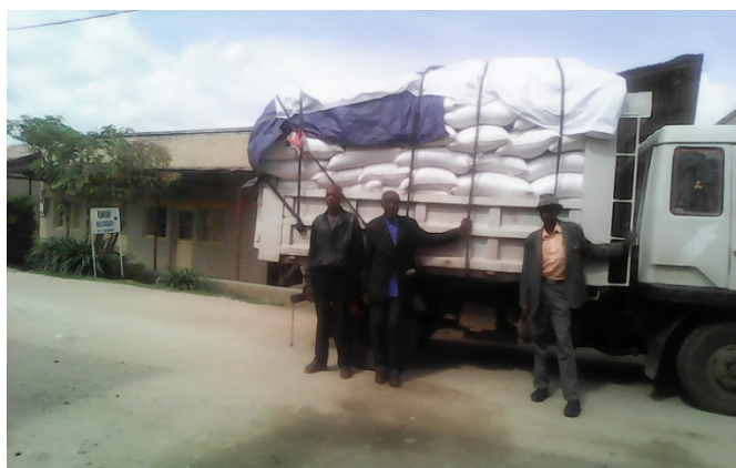
Collecte de la production des Cooperatives