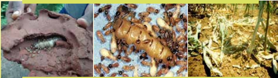
Fakkii 13: Rirma mootii kan agarsiisuu fi balaa midhaan irraan gahuu danda'u kan agarsiisu dha

Gosa raammoo 'Afrikan bollworm' to'achuuf: