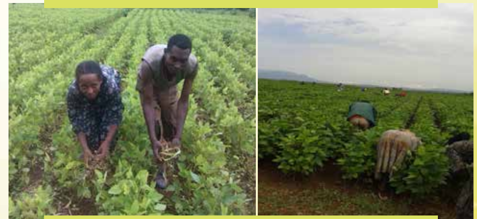
FFakkii 6: Oyiruu aramaan Akurii atarii keessaa harkaan to'atame kan agarsiisu dha