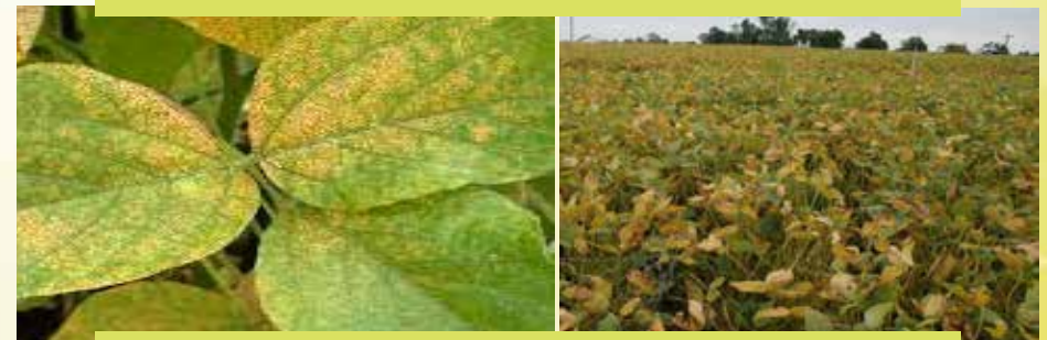
Fakkii 8: Mallattoo dhukkuba waagii baala Akurii atarii irratti kan mul'ate kan agarsiisu dha

Dhukkuba Waagii to'achuu: dhukkuba kana to'achuuf keemikaala riidoomilii (Redomil) jedhamuu heektaaratti leetira 1.5 fayyadamuun salphumatti to'achuun ni danda'ama.