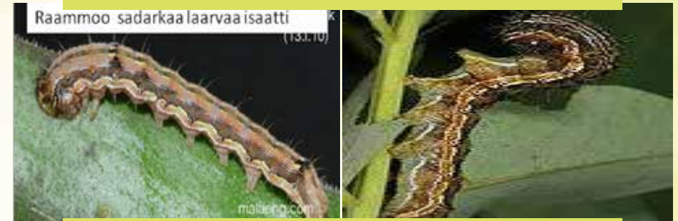
Fakkii 14: Raammii gosa 'Afrikan ballworm' jedhamu yeroo baala midhaani nyaachaa kan jiru kan agarsiisu dha

Keemikaala daayimetootti (39% dimethoate) heektaaratti miilii leetira 20 bishaanitti bulbulanii itti biifuu dha. Kana malees, marsaan facaasuu, sanyii dandamachuu danda'u fayyadamuu, seeraan gaggara garchanii qotuu fi waqtii mijaawaa ta'ee keessa facaasuunin gosa raammoo kana to'achuun ni danda'ama.