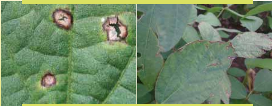
Fakkii 10: Mallattoo dhukkuba firogiaayii liif ispoottii (frog eye leaf spot) baala Akurii atarii irratti kan mul'ate kan agarsiisu dha

Dhukkuba firoog ayi liif ispoottii (frog eye leaf spot) to'achuu: Akkuma liif biloochii Keemikalaa kosaayidii (cosaide) jedhamu kilograama lama (2 kg/ha) ykn riidomiilii (redomil) leetra tokko fi walakkaa (1.5 l/ha) heektaara tokkotti yeroo mallaattoo armaan gadii fakkatuu kana baay'inaan baala irratti mul'achuu jalqabetti fayyadamun dhukkuba kana to'achuun ni danda'ama.