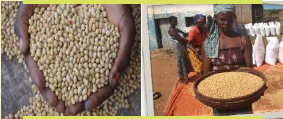
Fakkii 17: Midhaan/ Sanyii Akurii atarii qulqullaa'ee, sadarkaa'ee meeshaatti naqamee mana kuussaatti guuruuf qophaa'e kan agarsiisu dha