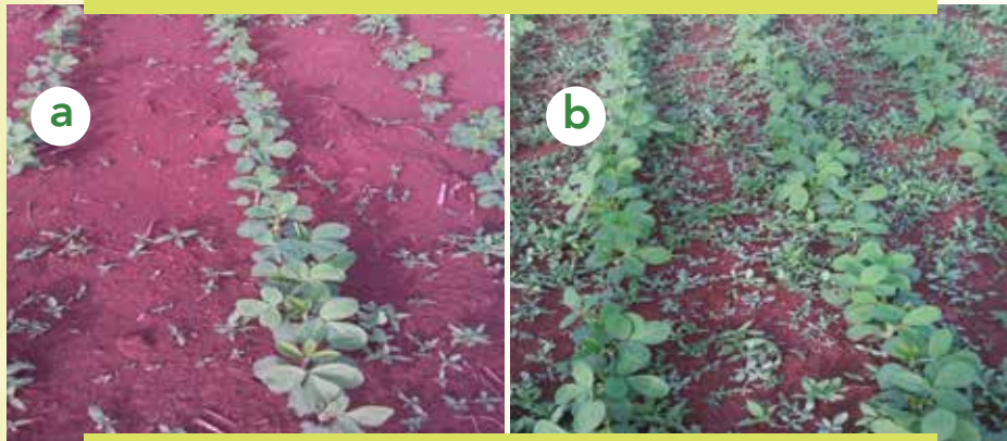
Fakkii 7: Agarsiisa keemikaala 'dual gold' faca'ee guyyaa tokko booda itti godhamee (a) fi kan itti hin godhamiin (b) kan mul'isu dha

Hubaachisa: Keemikaalonni armaan olitti eeraman kun osoo midhaan hin biqiliin dura aramaa gosa adda addaa biqilan kan ajjeesu yoo ta'u midhaan biqilee erga guddina jalqabee booda aramaa biqiluu danda'an ittisuu dhiisuu danda'a (Fakkii 7a). Kana malees, keemikaalonni tokko tokko aramaa gosa muraasa ta'e qofa ajjeessa. Kanaaf, Keemikaalota kan itti yoo fayyadamani akka barbaachisaa ta'etti altokko ykn lama (yeroo baay'ee barbaachisaa miti) harkaan aramuun barbaachisaa dha.