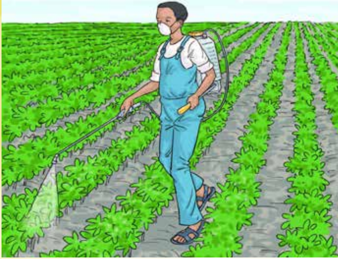
Fakkii 15: of-eeggannoodhaaf meeshaatti fayyadamuun balaa keemikaala ofirraa ittisuuf kan agarsiisu