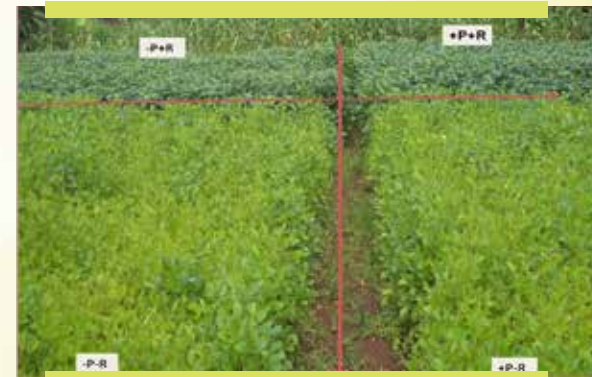
Fakkii 3: Agarsiisa yaalii xaa'oo uummamaa fi xaa'oo nam-tolchee (DAP) lafa qonnaan bulaa Aanaa Gobbuu Sayyoo ganda Gambeela Tarree keessatti hojjetame Hub: +P+R= DAP 50 kg/ha fi raayizobiyeemii godhame;-P+R= raayizobiyeemin qofa itti godhame;- P-R= xaa'oo hin qabu; +P-R= xaa'oo DAP 50kg/ha kan itti godhame dha.

Gosti xaa'oo raayizobiyeemii oomisha Akurii atariif ta'u yeroo a mmaa kana gabaa irra kan jiru gosa TAL-378, legume fix (LF) kan dhaabbata dhuunfaa Mennagashaa BaayooTek (Menagesha BioTec) tiin oomishamaa jiruu fi TAL-379 immoo Laaboraatorii Qorannoo biyyee Biyyoolessaan kan oomishamaa jiru dha.