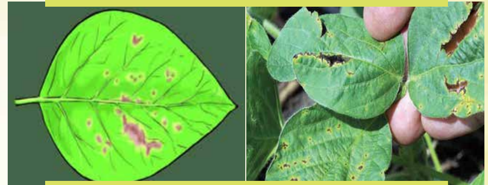
Fakkii 11: Mallattoo dhukkuba baakteeriyali bilaayitii (bacterial blight) baala Akurii atarii irratti kan mul'ate kan agarsiisu dha

Dhukkuba baakteriyaalii bilaayitii (bacterial blight) to'achuu: dhukkubni kun mallattoo bifa fakkii armaan gadii fakkaatu kanaan baala miidhame irratti mul'ata. Gosa keemikalaa kosaayidii (cosaide) ykn kooppeerii j edhamu heektara tokkottii kilograama lama (2kg/ha) biifuudhaan dhukkuba kana salphatti to'achuun ni danda'ama.