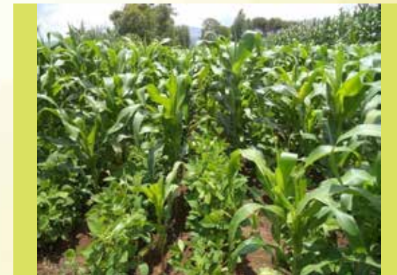
Fakkii 5: Agarsiisa akurii atarii toora Boqqoolloo (BH540) lamaan gidduu faca'e

Walkeessa facaasuu jechuun midhaan gosa gara garaa altokkotti oyiruu tokko irratti facaasuu jechuu dha. Fakkeenyaaf, Boqqoolloo fi Akurii atarii walkeessa facaasuun ni danda'ama. Kunis, Boqqoolloo guddinni isaa gaggabaabaa ta'ee fi giddu galeessaan dafee kan ga'u (fkn. BH 540, BH543, BH546, BH547, Gibe1, Gibe 2 fi Gibe 3) danda'an keessa Akurii atarii giddu galeessan dafani gahan (fkn. Dhidheessaa) facaasuun ni danda'ama. Kanaaf, Boqqoolloon faca'ee guyyaa kudhan booda toora boqqoolloo lamaan gidduu Akurii atarii facaasuun ni danda'ama.