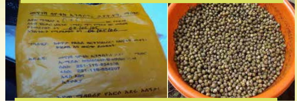
Fakkii 2: Xaa'oo uummamaa paakeetiin qophaa'ee (bitaa) fi kan sanyii Akurii ataritti waliin makame (mirga) kan agarsiisu dha

Hubachiisa: Raayizoobiyeemin yeroo tokko sanyii wajjin yoo faca'ee haala qilleensa naannoo, jiidhinsa fi gabbina biyyee akkasumas haala oomisha Akurii atarii naannichaa irratti hundaa'uun hanga waggaa 2-4tti biyyee keessa turuu ni danda'a. Kanaafuu, oomisha Akurii atarii oyiruu tokko irratti wagga waggaan raayizobiyeemii itti gochuu irra walirraa fageenya waggaa 2-3n itti gochuun barbaachisaa dha.