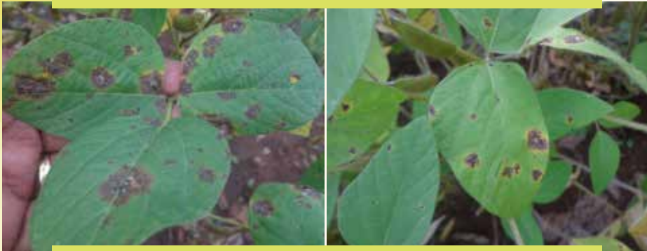
Fakkii 9: Mallattoo dhukkuba liif biloochii (leaf Bloch) baala Akurii atarii irratti kan mul'ate kan agarsiisu dha

Dhukkuba liif biloochii (leaf blotch) to'achuu: dhukkubni kun mallattoon isaa fakkii armaan gadii baala irratti mul'atu kana yoo fakkaatu keemikaala kosaayidii (cosaide) heektaaratti kilograama lama (2kg) ykn riidomiilii (redomil) heektaaratti leetira tokkoo fi walakkaa (1.5L) fayyadamuun to'achuun ni danda'ama.