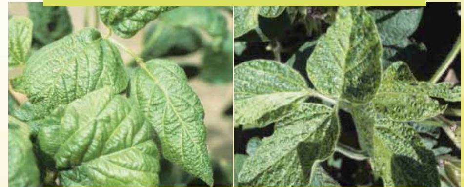
Fakkii 12: Mallattoo dhukkuba mosa'iki vaayirasii (mosaic virus) baala Akurii atarii irratti kan mul'ate kan agarsiisu dha

Dhukkuba mooza'ikii vaayiresii (mosaic virus) Akurii atarii irraa to'achuu: dhukkubni kun mallattoo fakkii baalaa armaan gadiitti eerame kana yoo fakkaatu baala waliitti shuntuursee guddina biqilaa quucarsa. Dhukkubnii kun ilbisootaa dhukkuba baatanii dabarsuu danda'aniin kan daddarbu yoo ta'u ilbiisota kana to'achuun dhukkubicha to'achuun ni danda'ama. Kanaaf keemikaala farra ilbiisaa ta'an kan akka dimootoyetii (demethoate 40%) fi 15% Tiyametogzanii (thiamethoxan 20%) itti naquun to'achuun ni danda'ama.