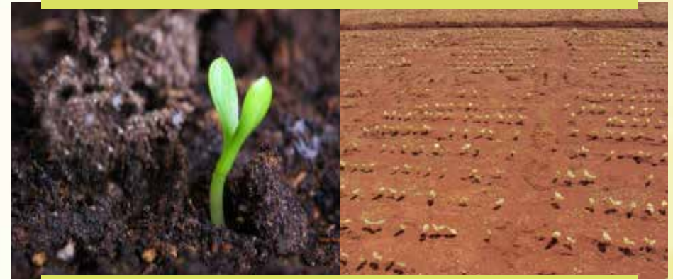
Fakkii 1: Sanyii Akurii atarii jalqaba yeroo biqiluu gurra lama kan baafate kan agarsiisu dha

Haalli guddina Akurii atarii bakka gurgurdoo lamatti yoo qoodamu, innis haala guddina guyyaa biqilee jalqabee hanga daraaruu jalqabutti (vegetative stage) yoo ta'uu inni lammaffaan immoo sadarkaa daraaruu jalqabee hanga sootala naqatee bilchaatutti sadarkaa dagaaginaa (reproductive stage) jedhama.