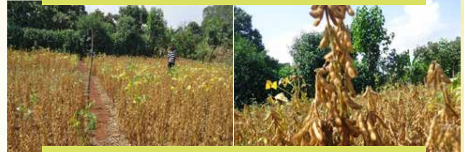
Fakkii 16: Akurii atariin gahuu isaa ooyiruu irratti kan agarsiisu dha